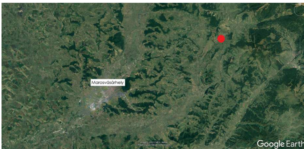
Mikháza elhelyezkedése Maros Megyében