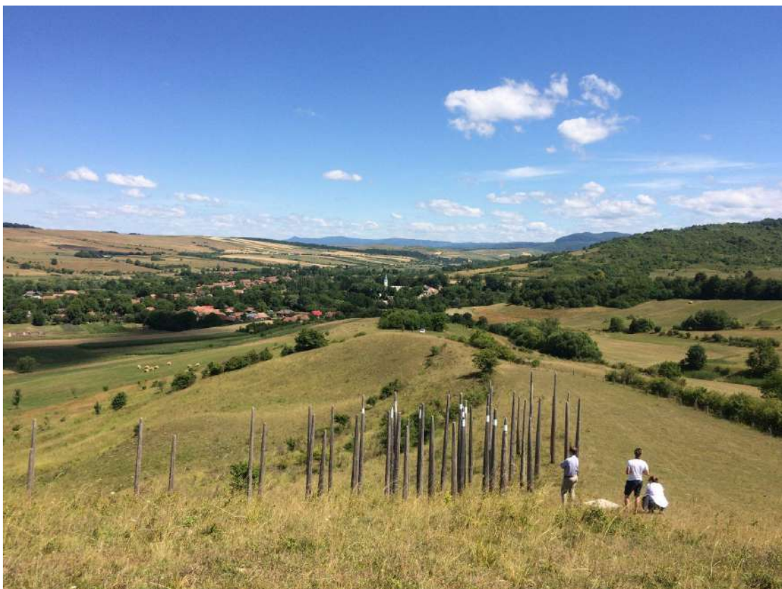
Mikháza és a Nyárád völgy látképe a Tájoló Kilátótól