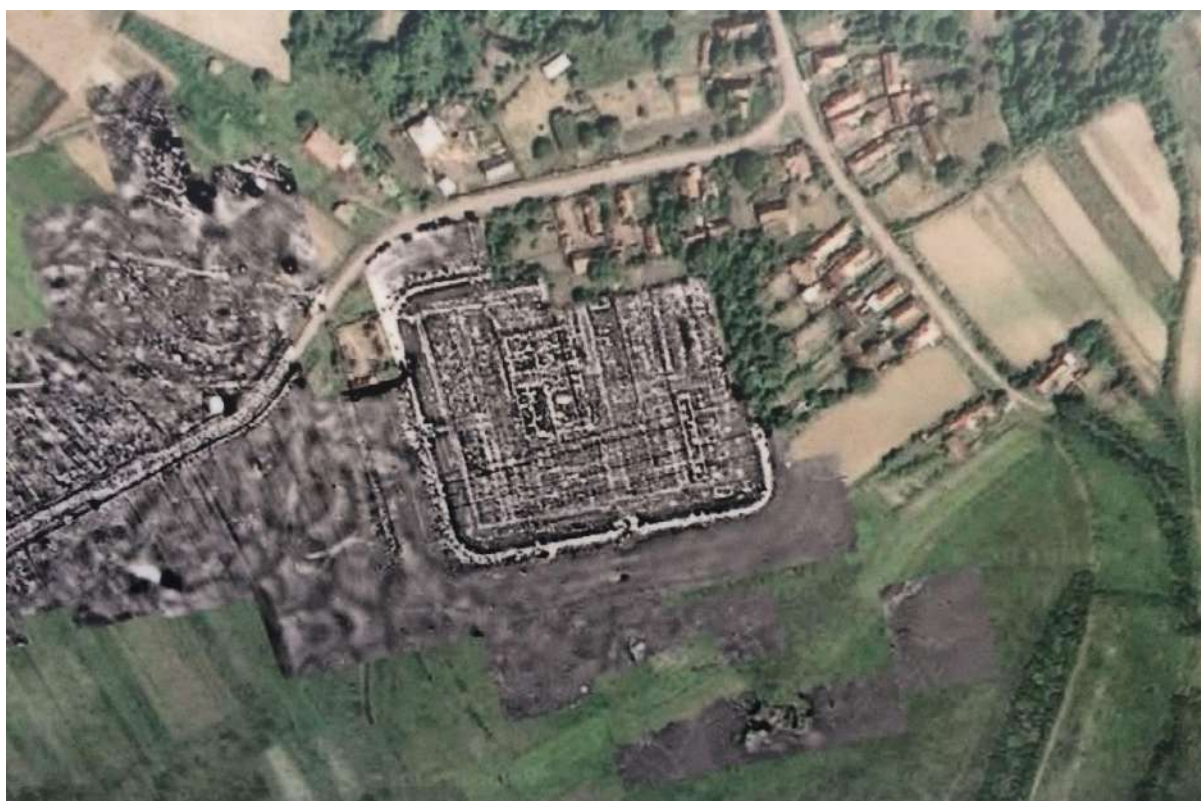
A régészeti lelőhely pozíciója a falu délnyugati határában. A tervezési terület az elágazásban, a déli sarkon található