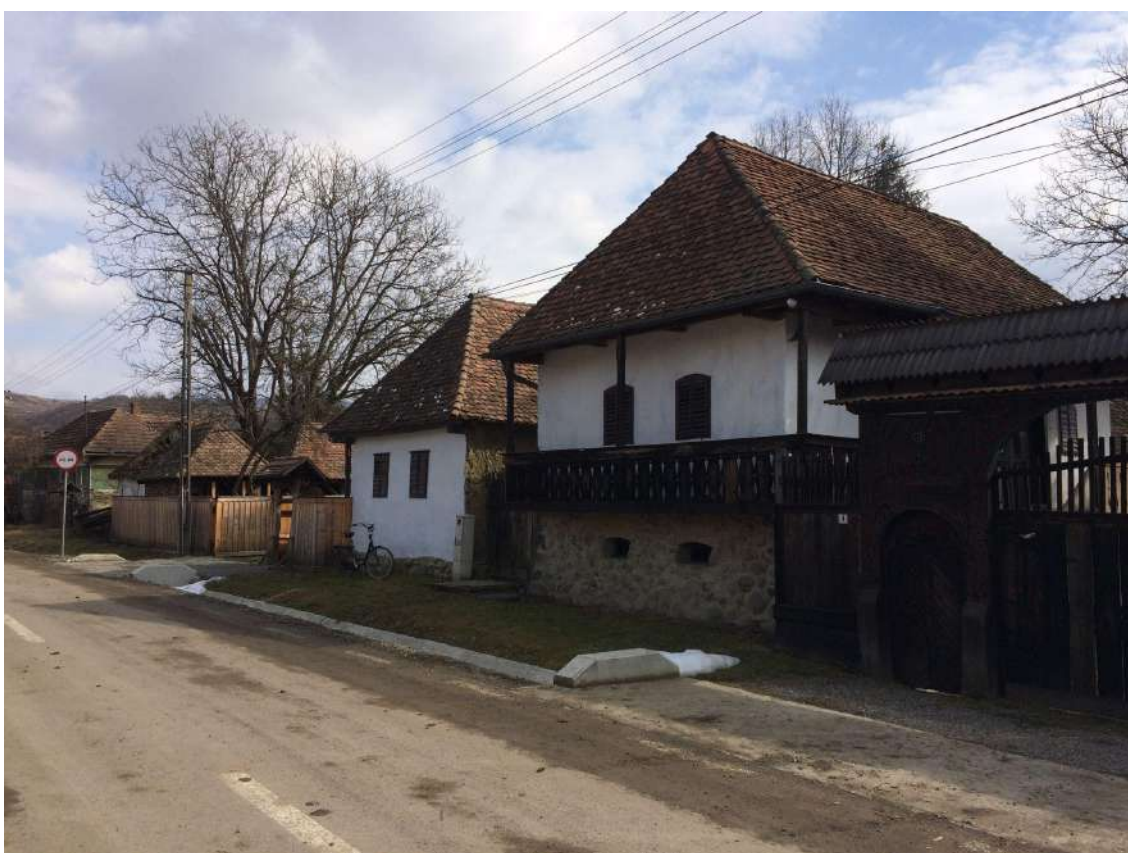
A Múzeum által felújított 4-es és 5-ös számú porták. A tervezési terület a kép bal szélén, a 6-os számú porta területe